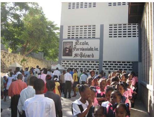
El día de la Inauguración el pasado

Las instalaciones que Acoger y Compartir www.acogerycompartir.org promovieron en Puerto Príncipe, financiadas en parte por las cenas organizadas en Tenerife, se han venido abajo por la fuerza del terremoto de hace cuatro días, provocando una masacre más en la isla, totalmente asolada .