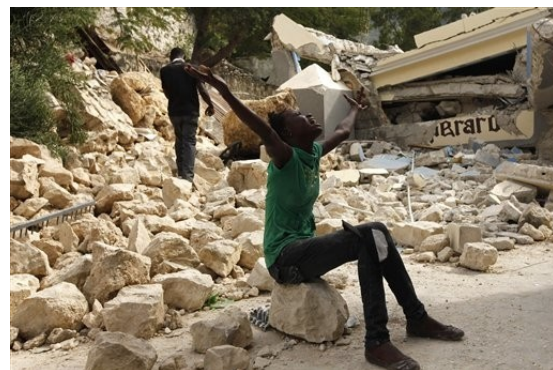
Estado actual de la escuela

Cerca de 300 personas, entre las que se encuentran numerosos niños, han fallecido en el derrumbe de la escuela parroquial de San Gerardo, uno de los muchos edificios destruidos en el seísmo de siete grados de magnitud en la escala Richter que asoló el país hace cuatro días.