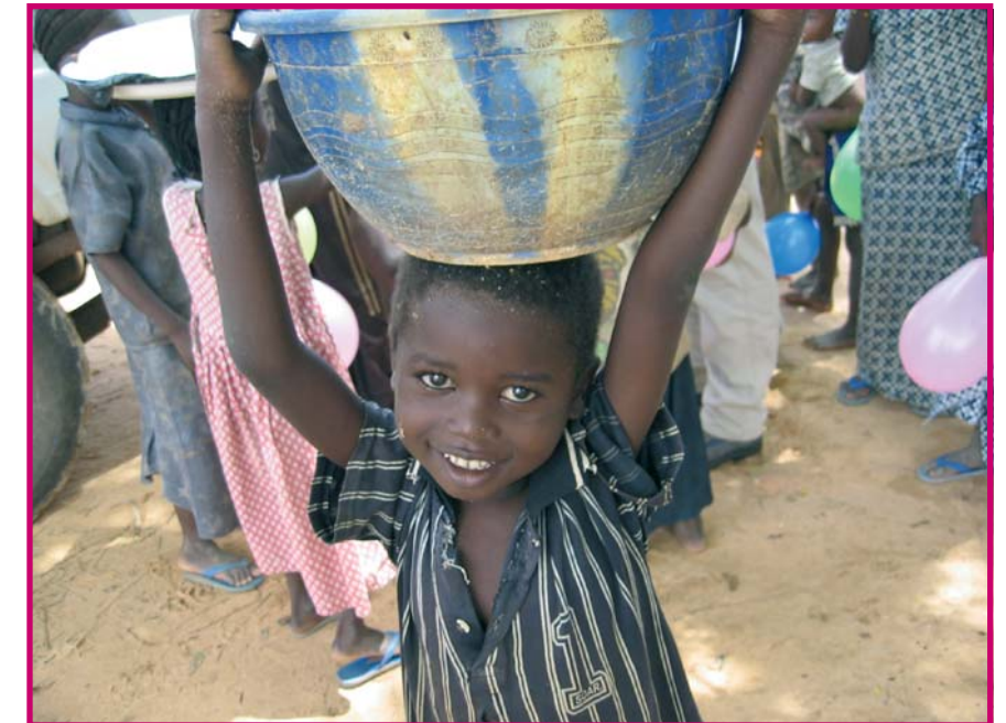
La desnutrición es "el hambre silenciosa" que afecta a millones de niños africanos

Igualmente, AyC ha participado en varios proyectos en la ciudad de Zinder: el centro nutricional de Kara-Kara en el barrio de leproso; becas a dos enfermeras (ATS) de ese dispensario para que puedan seguir estudios superiores en Salud durante tres años. También se compró un coche todo terreno, de segunda mano, para que el dispensario de St. Joseph, construido en la periferia en años anteriores, pueda extender su acción a los poblados de los alrededores.