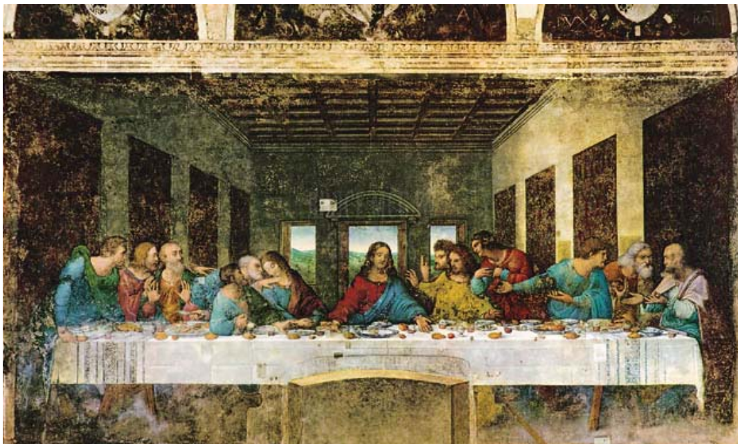
(Última Cena, de Leonardo Da Vinci, Convento de Santa Maria delle Grazie (Milán). La figura a la izquierda de Cristo no es María Magdalena, como afirma la novela de Dan Brown, sino el Apóstol San Juan, en el momento en que escucha una indicación de San Pedro.

Ser cristiano es permanecer en este amor, junto a otros que viven también esta comunión única que llamamos Iglesia. Ser amigos de Cristo y amigos de Dios, concedores de este secreto a voces: Dios es amor. La Iglesia es, en su esencia, un “círculo de amigos”, que se quieren, a pesar de todo.